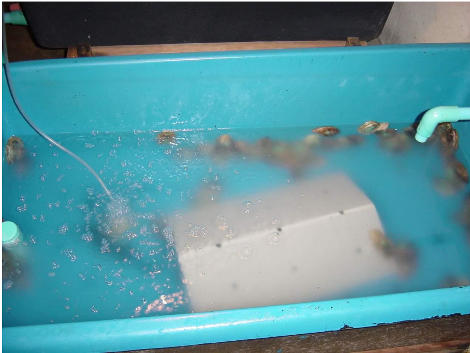
รูปที่ 3 การเลี้ยงฟองพันธุ์หอยเป่าฮื้อ