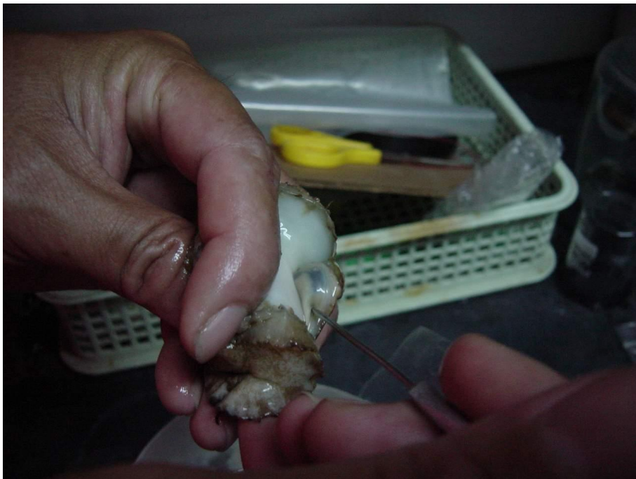
รูปที่ 4 ตำแหน่งของอณฑะในฟองพันธุ์หอยเป่าฮื้อ