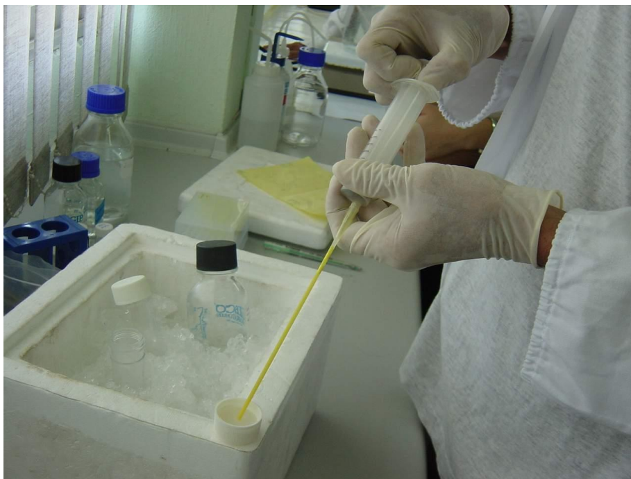
รูปที่ 7 การบรรจุน้ำเชื้อพ่อพันธุ์หอยเป่าฮือใส่ในหลอดฟาง