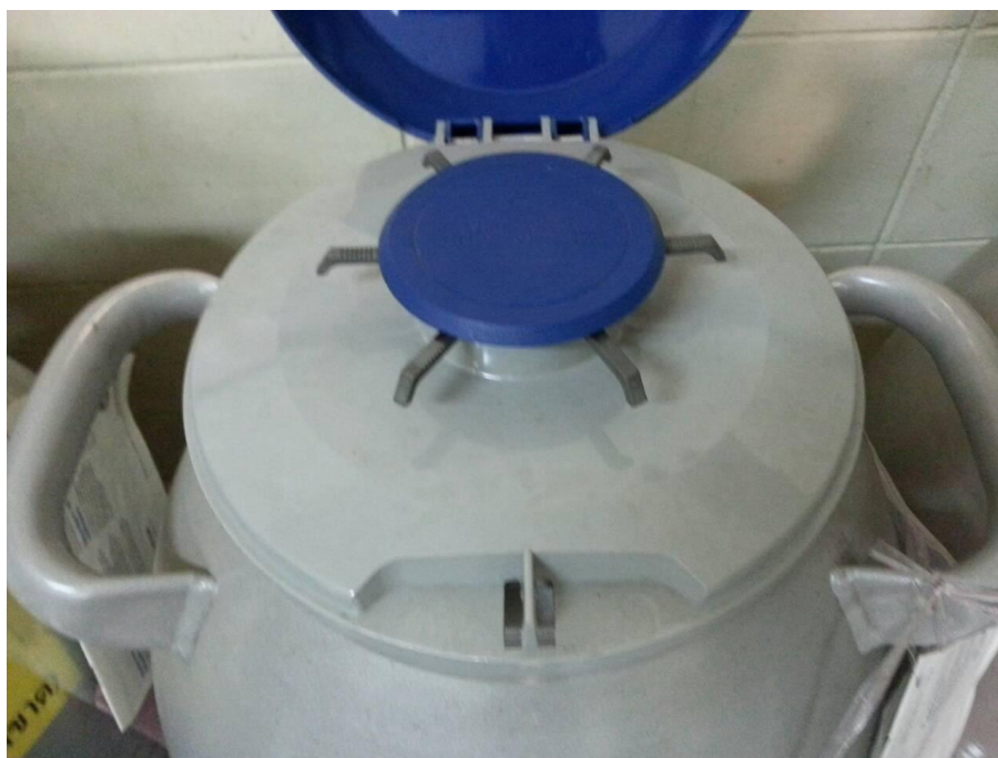
รูปที่ 8 การเก็บรักษาเชื้อหอยเป่าฮือแช่แข็งไว้ในถังไนโตรเจนเหลว