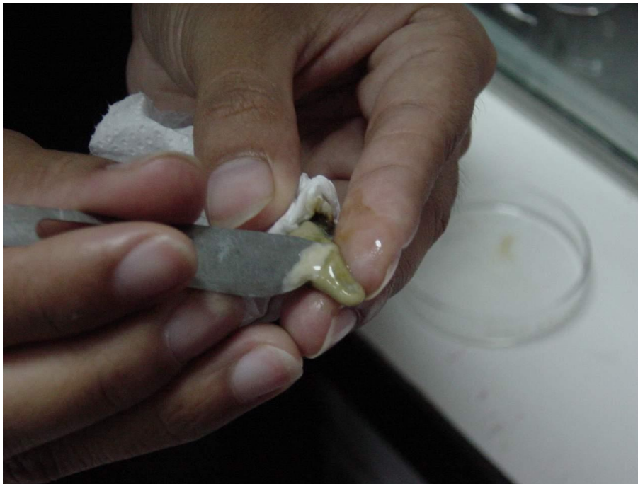
รูปที่ 6 การรวบรวมน้ำเชื้อจากพองพันธุ์หอยเป่าฮื้อ