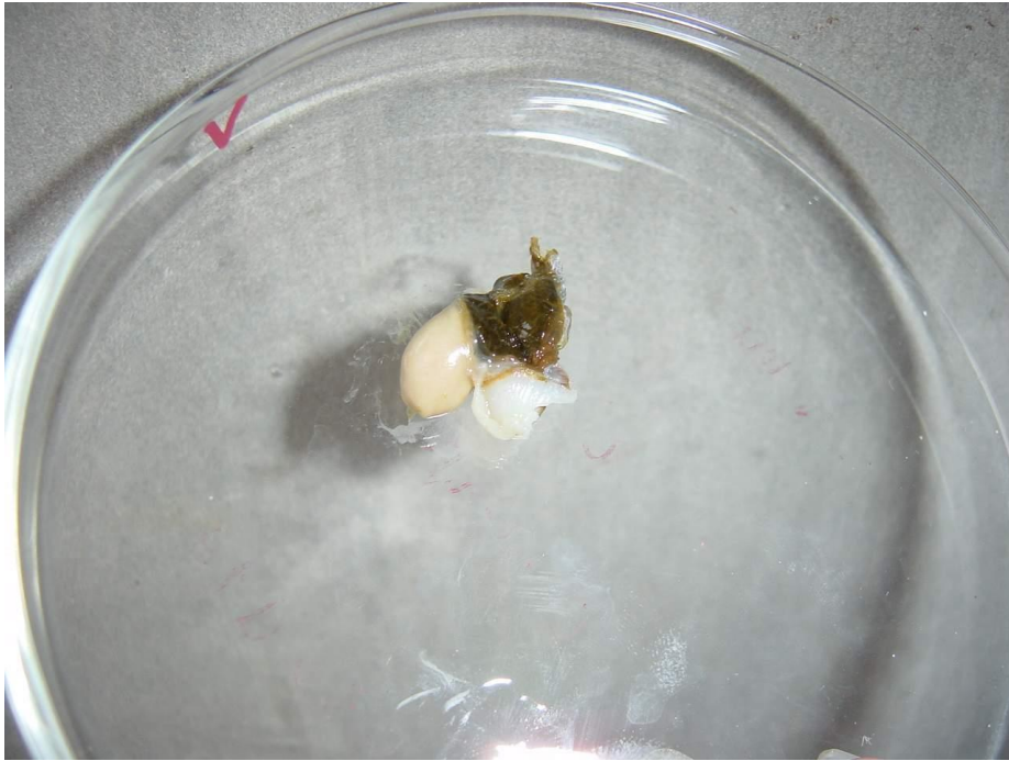
รูปที่ 5 ลักษณะอันตะพองพันธุ์หอยเป่าฮื้อที่นำออกมาจากตัวหอย