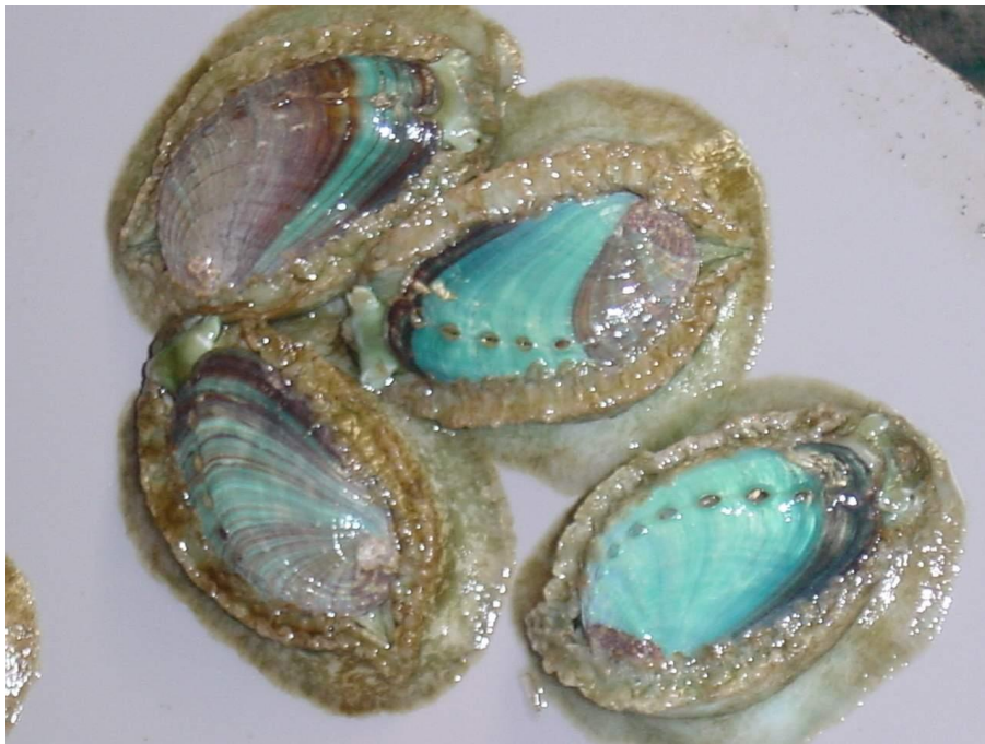
รูปที่ 2 ลักษณะฟอพันธุ์หอยเป่าฮื้อที่ใช้ในการทดลอง