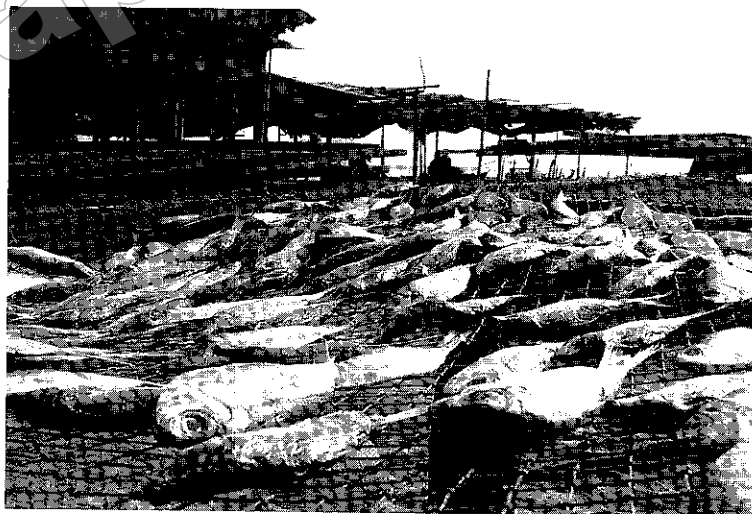
ภาพที่ ๓ ปลาตากแห้ง

เมื่อนำปลาและสัตว์ทะเลต่างๆ กลับบ้านก็จะแบ่งออกเป็น ๒ ส่วน ในส่วนหนึ่งจะเอาไว้ขาย ซึ่งจะมีพ่อค้าคนกลางมารับที่สะพานปลา ส่วนที่เหลือก็จะเอามาปรุงเป็นกับข้าวสด เช่น น้ำพริกปลา ป่นปลา ปลาเผา ปลาปิ้ง ปลาย่าง ฯลฯ