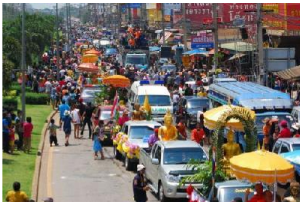
ประเพณีวันไหลสระแก้ว (แห่พระปรัง)