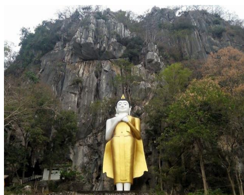
วัดถ้ำเขาคกรรจ์