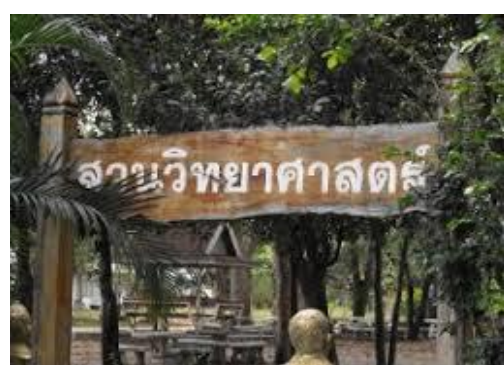
โรงเรียนวังน้ำเย็นวิทยาคม