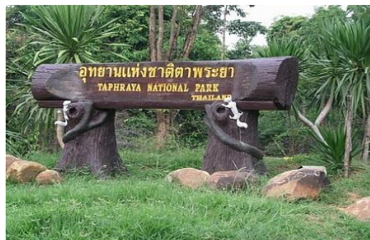
อุทยานแห่งชาติตาพระยา