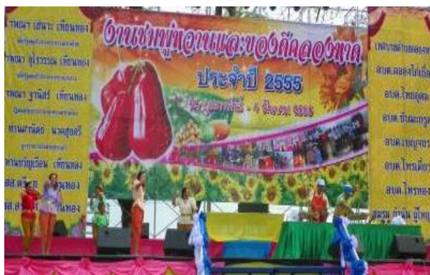
ประเพณีงานชมพuhan