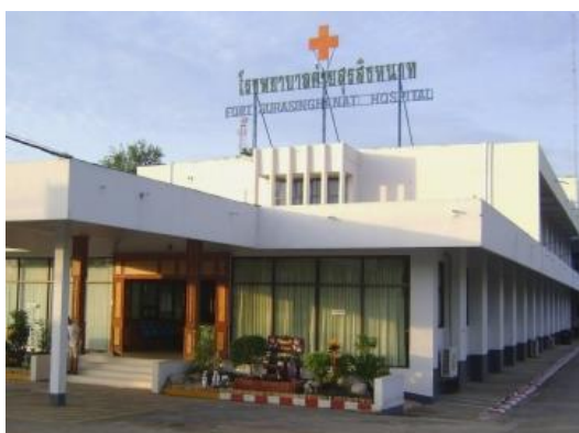
โรงพยาบาลค่ายสุรสิงหนาท