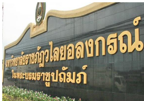
มหาวิทยาลัยราชภัฏวไลยอลงกรณ์ ในพระบรมราชูปถัมภ์ สระแก้ว