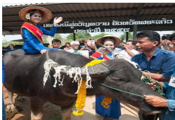
ประเพณีสู้ขวัญควาย (ประกวดธิดากาสร)