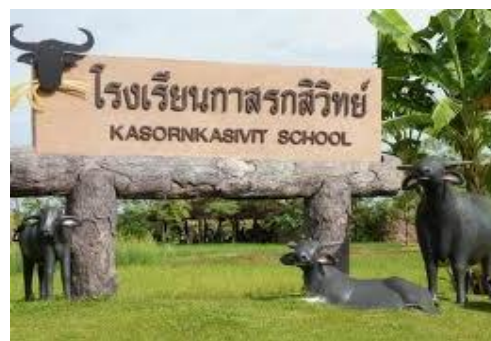
โรงเรียนกาสรกสิวิทย์