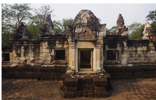
ปราสาทศักดิ์ก้อกรม