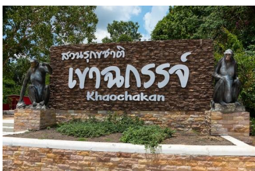
สวนรุกขชาติเขาชะกรัง