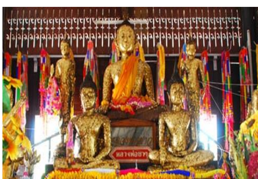
วัดนครธรรม