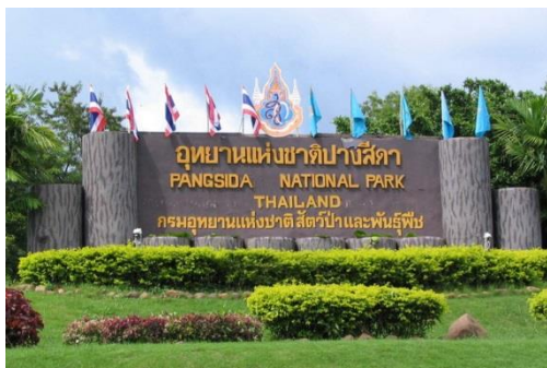
อุทยานแห่งชาติปางสีดา