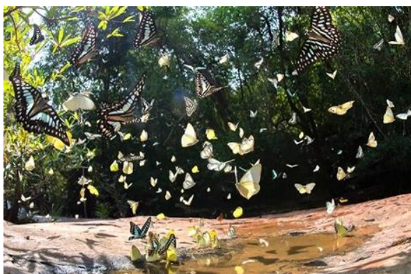
เทศกาลคูผีเสื้อ