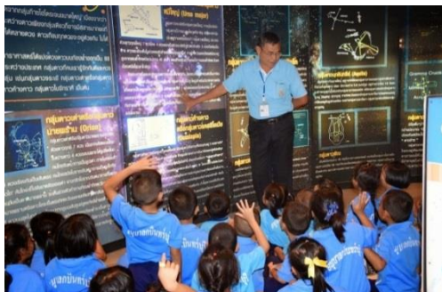
ศูนย์วิทยาศาสตร์เพื่อการศึกษาสระแก้ว