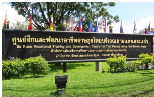
ศูนย์ฝึกอาชีพและพัฒนาราษฎรไทย บริเวณชายแดนสระแก้ว