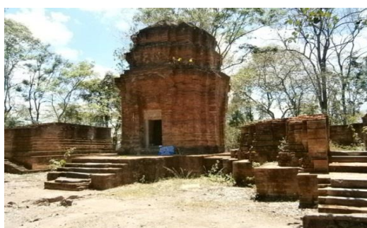
ปราสาทเขาน้อยสิชมพู่