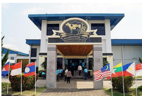
สหกรณ์โคนมวังน้ำเย็น จำกัด