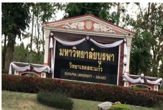
มหาวิทยาลัยบูรพา วิทยาเขตสระแก้ว