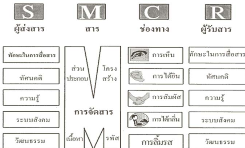
ภาพที่ 2 รูปแบบจำลอง SMCR ของเบอร์โล (Berlo, 1960, pp. 40-71)

การติดต่อสื่อสารไว้ในลักษณะรูปแบบจำลอง SMCR Model (ดังภาพที่ 2) อันประกอบด้วย