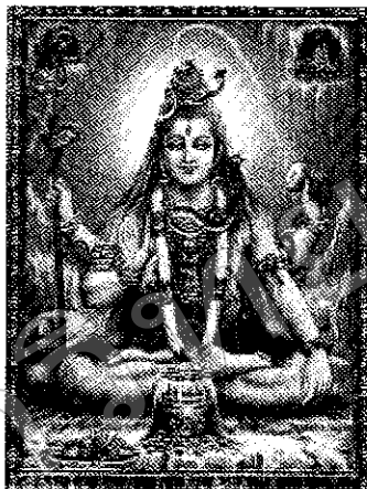
ภาพที่ ๑ พระศิวะ (Narain, n.d.)