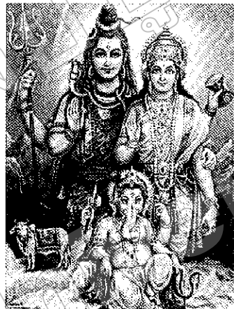
ภาพที่ ๒ พระศิวะ พระนางปารวตี และพระคณศ (Background Information for Teachers, c1997)