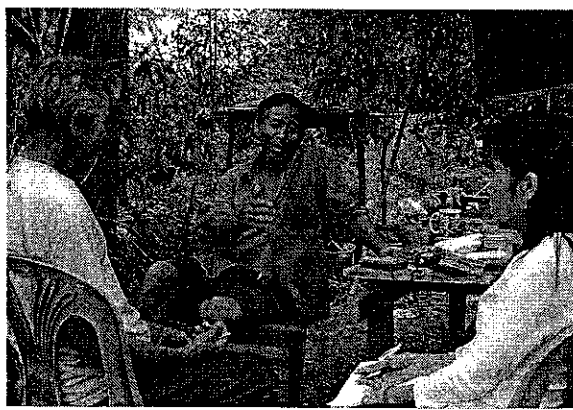
ภาพที่ 19-20 พ่อเพลง-แม่เพลงบ้านพรงลำบิด

พ่อเพลงทั้งหมดของกลุ่มนี้ทุกคนมีอาชีพหลักคือการทำนา ทำอาชีพนี้มาตั้งแต่บรรพบุรุษ ตั้งแต่เกิดมาก็ได้สัมผัสกับชีวิตชนบท คลุกคลีกับท้องไร่ท้องนา ดำรงชีวิตแบบเศรษฐกิจพอเพียง เยี่ยมชีวิตลูกชาวนาทั่วไป ที่เรียนรู้วิถีชีวิตของชาวนามาจากครอบครัว พ่อแม่ ปู่ย่า ตายาย