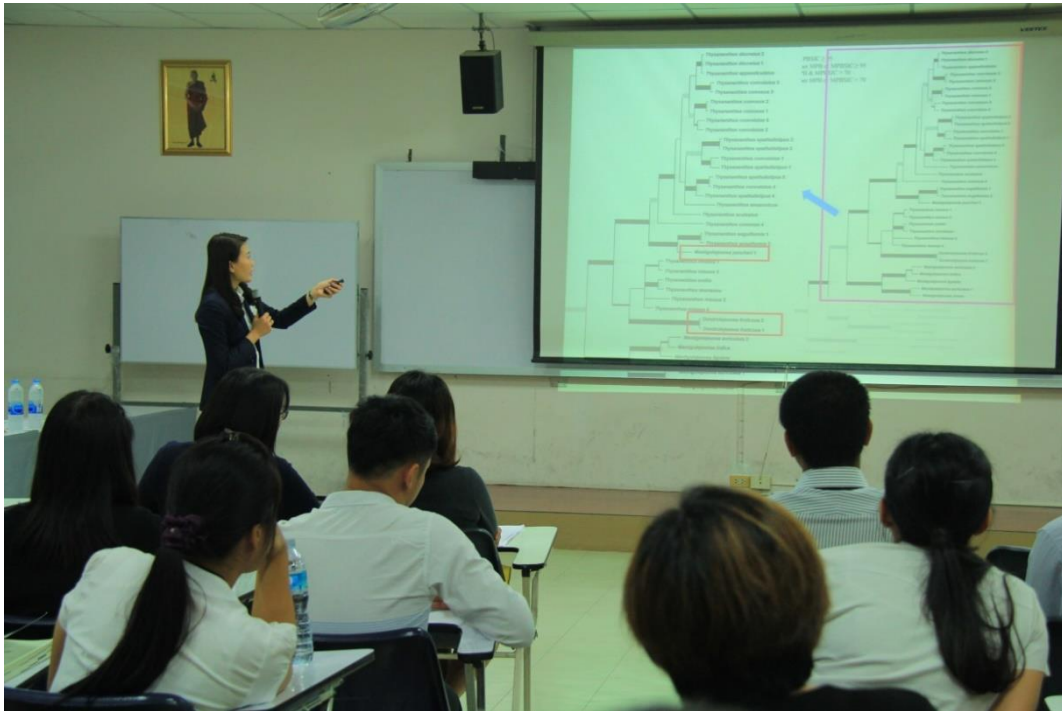
ภาพที่ 3 บรรยายพิเศษในฐานะวิทยากรรับเชิญ ในการประชุมวิชาการระดับชาติ “วิทยาศาสตร์วิจัย ครั้งที่ 9”