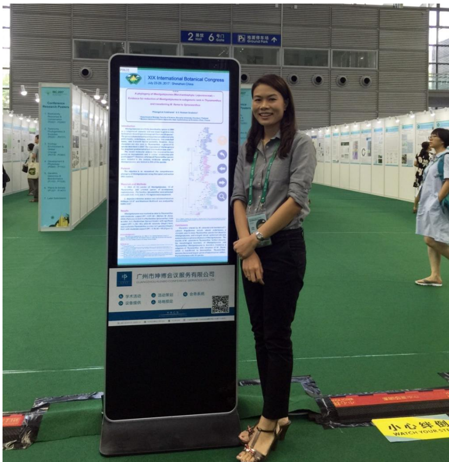
ภาพที่ 5 นำเสนอผลงานวิจัยแบบโปสเตอร์อิเล็กทรอนิกส์ (e-poster) ในการประชุมวิชาการระดับนานาชาติ “XIX International Botanical Congress 2017”