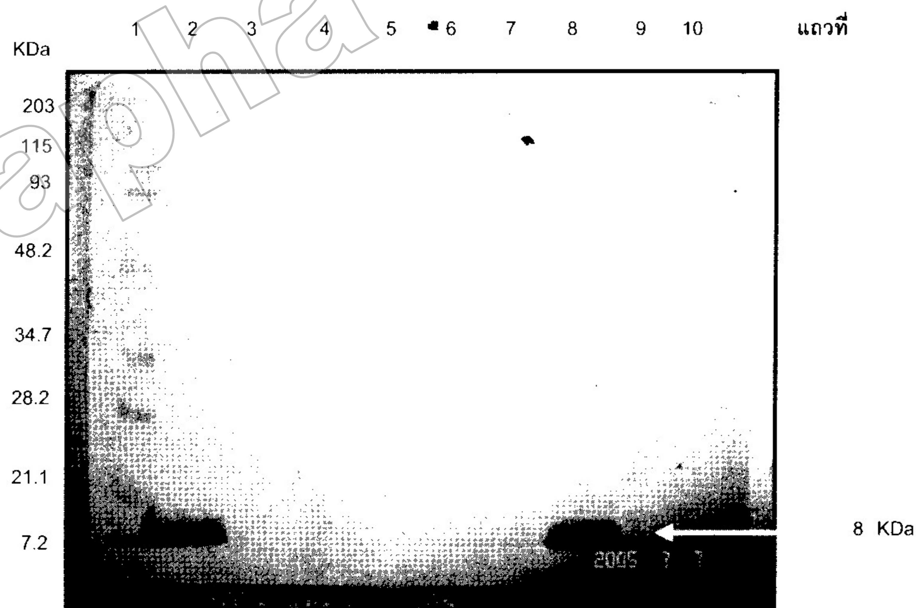
ภาพที่ 2 Western Blotting ของการตรวจสอบ V. harveyi ระหว่าง ชนิดที่ก่อโรครุนแรงกับสายพันธุ์อื่น ซึ่งแถว 2 เป็น V. harveyi 1526 และ แถว 8 เป็น V. harveyi จากฟาร์มกุ้งกุลาดำจังหวัดสุราษฎร์ธานี โดยผลบวกจะเห็นเป็นแถบสีน้ำตาลที่ 8 kDa แถว (1) Prestained SDS-PAGE Standards Broad Range 92290 (BIO-RAD) (2) V. harveyi 1526 (3) V. alginolyticus DMRT 14800 (4) ลำตัวเพรียงเลือด (5) V. harveyi KCTC 2717 (6) กุ้งกุลาดำ 5 (Hepatopancreas) (7) กุ้งกุลาดำ 3 (Hepatopancreas) (8) V. harveyi จากฟาร์มกุ้งกุลาดำจังหวัดสุราษฎร์ธานี (9) V. harveyi 47666-1 (10) ปูม้าระยะชูเอี้ยง 2

แถว C : (1) V. harveyi จากฟาร์มกุ้งกุลาดำจังหวัดสุราษฎร์ธานี (2) V. harveyi VHS1 (3) V. harveyi PBN (4) V. harveyi HLV (5) V. harveyi IBN (6) V. anguillarum AVL 01 (7) ปูม้าระยะชูเอี้ยง 2 (8) กุ้งกุลาดำ 1 (Hepatopancreas) (9) หอยนางรม 2 (ทางเดินอาหาร) (10) กุ้งกุลาดำ 3 (Hepatopancreas)