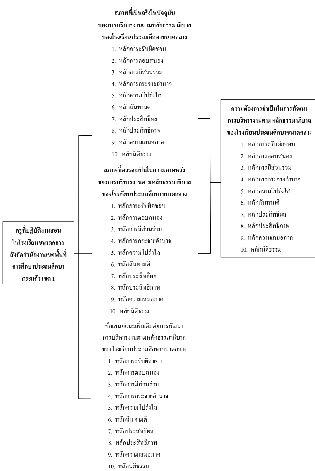
ภาพที่ 1 กรอบแนวคิดในการวิจัย