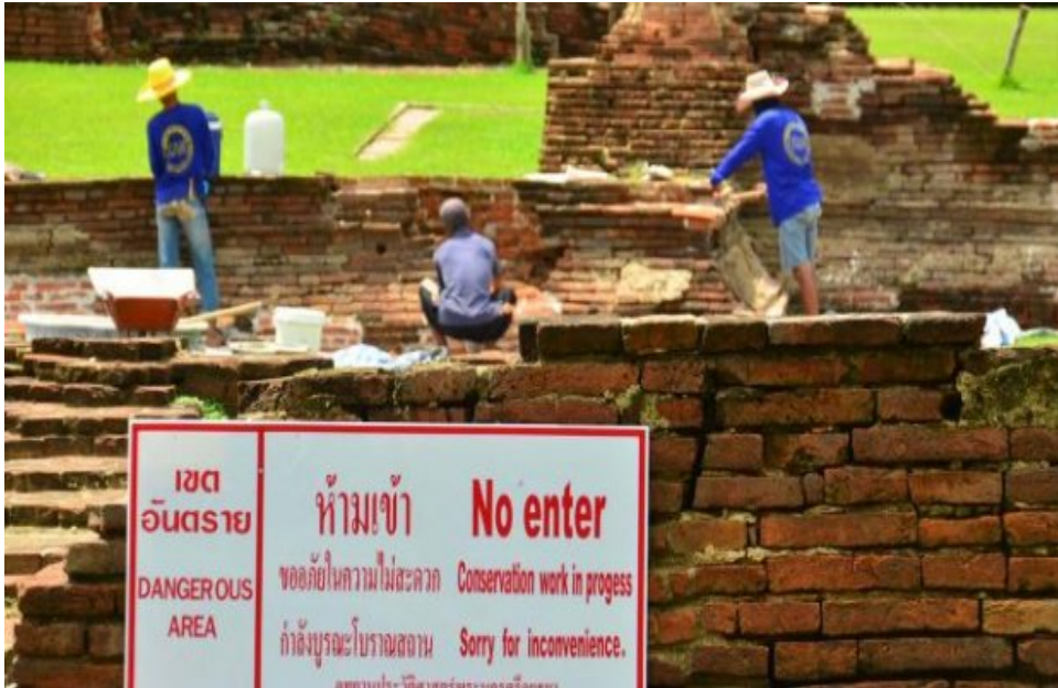
ภาพที่ 3 การเสริมฐานล่างโบราณสถาน