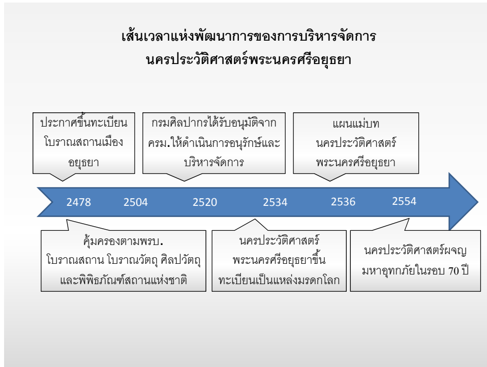
ภาพที่ 1 เส้นเวลาแห่งพัฒนาการของการบริหารจัดการนครประวัติศาสตร์พระนครศรีอยุธยา

(Timeline of World Heritage Management in Historical City of Ayutthaya)