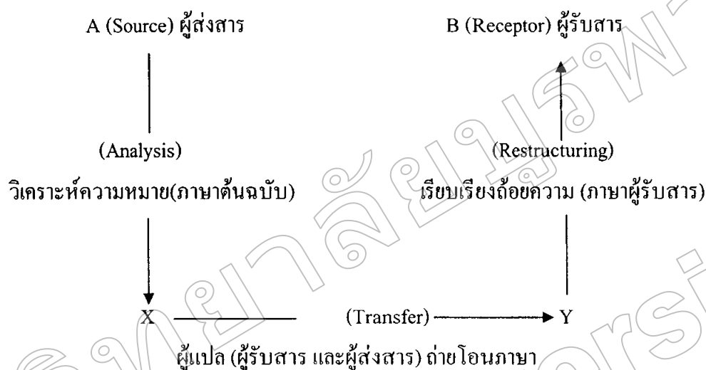
ภาพที่ 1 แบบจำลองการแปลของ Nida and Taber

และนิวมาร์ค (Newmark, 1988, p. 20) ได้เสนอแบบจำลองของการแปลที่มีลักษณะเป็นแบบจำลองของการสื่อสารเพื่อแสดงให้เห็นถึงความสัมพันธ์กันระหว่างการแปลกับการสื่อสารดังภาพที่ 1 และภาพที่ 2 ดังนี้